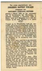
29 johannes baptist