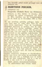
25 martin bidprentje