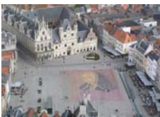
50 Grote Markt